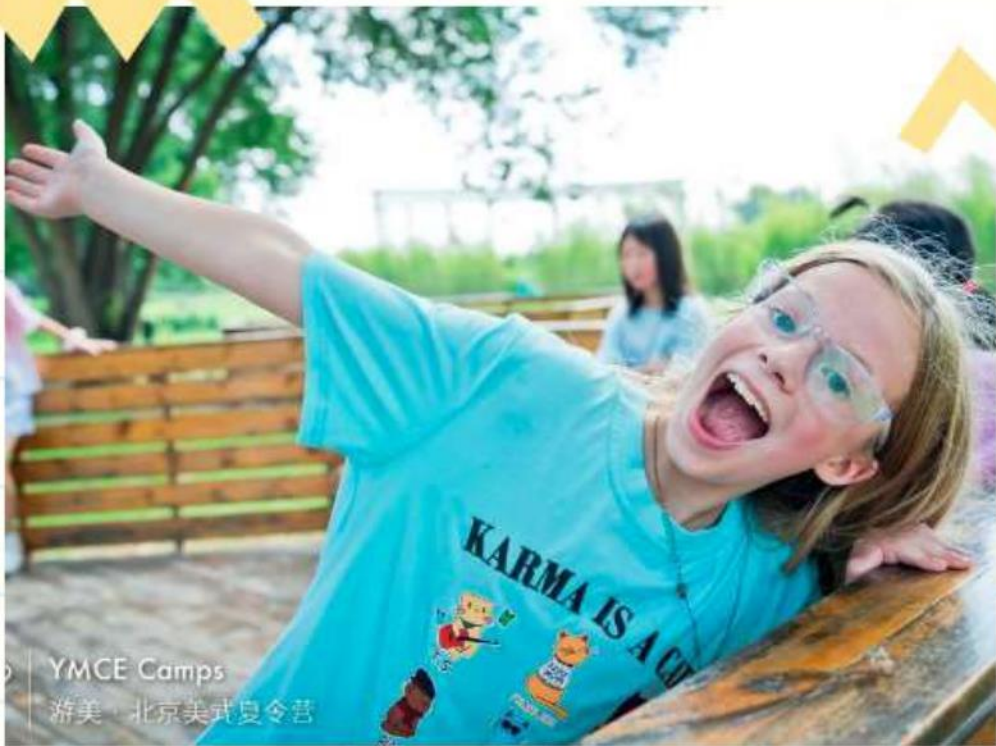
YMCE Camps 游美·北京美式夏令营